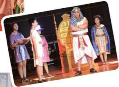
英語劇「Joseph and the Amazing Dreams」讓學生勇於在台上進行各式表演。