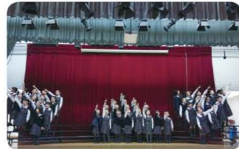
學生積極參與各類型比賽，去年榮獲校際英詩集誦比賽冠軍。