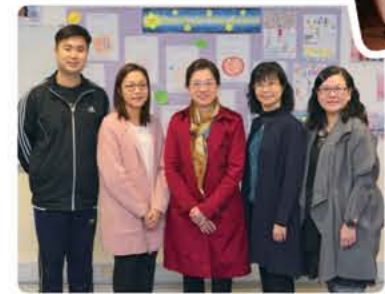
中華基督教會基慧小學 (馬灣) 的教師團隊，全心全意，優化學與教。