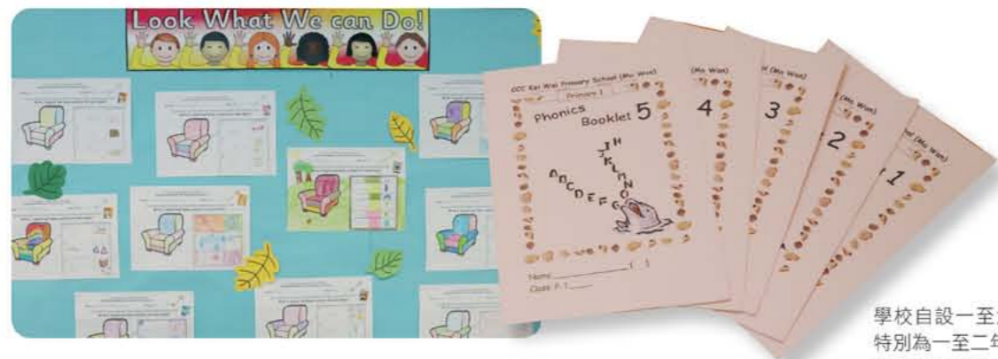
學校自設一至六年級校本英語課業，特別為一至二年級製作校本拼音教材，加強拼讀能力，助學生打好語文基礎。