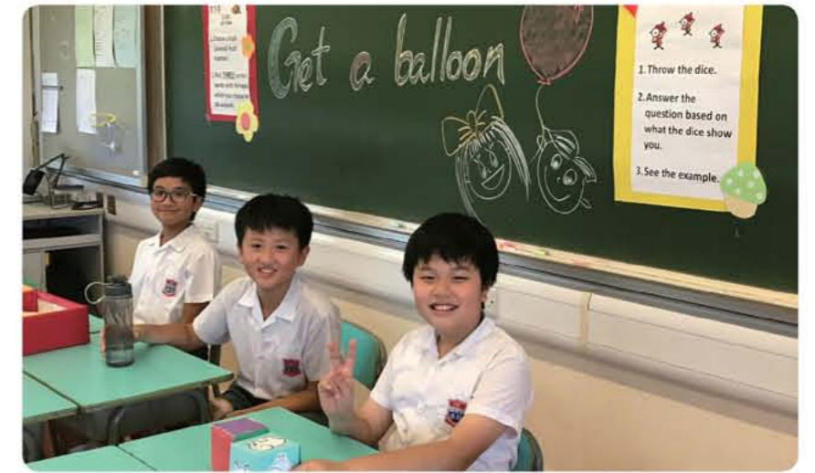
英語大使在學校開放日主持活動。

良好的語言環境，是推動學生學習的重要元素，所以學校每星期均安排學生於早會時段以英語向全校同學作閱讀推介，甚或是以話劇形式演繹故事內容。部份班級更會將閱讀分享，攝製成校園電視台節目，於午間活動時段在學校廣播，不但有助培養學生的閱讀習慣，更使同學有更多機會接觸、運用英語，一舉多得。何校長更指出：「學生閱讀後，經過消化、吸收故事內容，再向全校分享，是一個很好的學習過程。」也因為多了發表的機會，這裡的學生表現也相當主動，而且敢於表達自己，不但帶動了英語學習的成效，同時養成了學生勇於面對挑戰的個性。大概因為訓練有素，何校長表示學生們在每年開放日時，跟家長、外界人士互動溝通也相當自然、自信，反映學校多年來的教育果效。