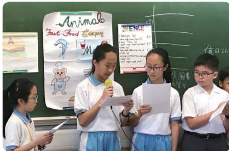
學生需進行專題研習小組匯報，掌握專題報告技巧，為升中作好準備。

雖然課外活動有助建立自信，但自信也需內涵的支持才能顯得紮實，所以學校在課程設計上也絕對一絲不苟，如校本拼音教材、校本英語課業和專題學習，都在提升學生聽說讀寫的能力，以加強學習英語的信心。何鳳儀副校長舉例說：「上一學年，我們的目標是提升學生的自學能力，所以在不同的課業和活動都推介一些網站，讓學生在每個單元之前先作預習，令課堂比以前更為順暢，老師更可騰出時間深化教學，並讓學生參與討論，增加活用的機會。」透過這些為學生度身訂造的校本課程，無論在提升學生協作、溝通、解難及自學能力方面都有了最佳的果效。